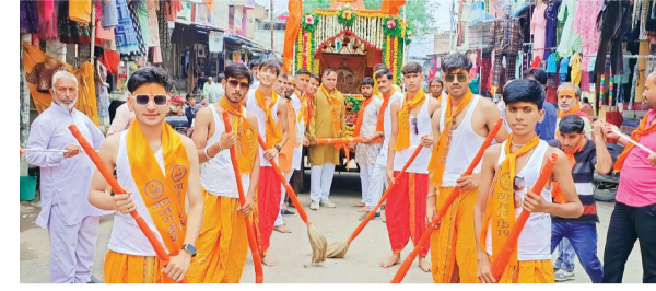
हरिभूमि न्यूज | कानड़

शनिवार सुबह नगर में हर्षोल्लास के साथ अखिल भारतीय चंद्रवंशी खाती समाज द्वारा भगवान जगन्नाथ की रथयात्रा निकाली गई। शनिवार सुबह 9 बजे बोरखेड़ी रोड स्थित खाती धर्मशाला में भगवान जगदीश की पूजन आरती कर भगवान जगदीश को सुसज्जित रथ में बैठा कर जगदीश यात्रा शुरू हुई जो कि खाती मोहल्ला, खरजा चौक, दयानंद मार्ग, कनकेश्वर