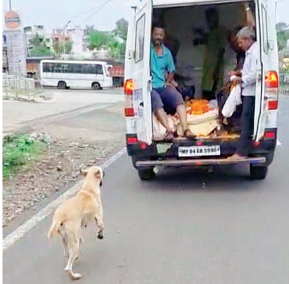
पाड़िलयाखेड़ी हाईस्कूल में बतौर व्याख्याता पदस्थ थे।