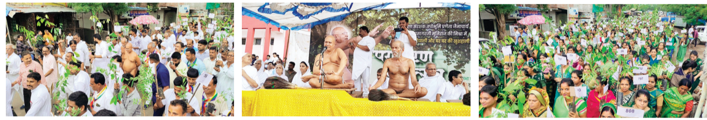
नलखेड़ा